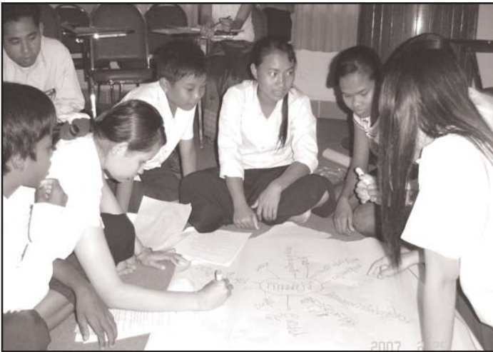
កិច្ចការក្រុមរបស់ក្រុមកុមារលើប្រធានបទ៖ ការអប់រំ