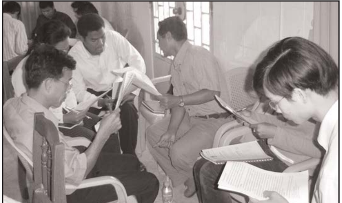
ការជជែកពិភាក្សាលើពង្រាងសេចក្តីថ្លែងការណ៍របស់សមាជិក គ. អ. ស. ក

- បង្កើនចំនួនចៅក្រម និងមេធាវីដែលមានជំនាញ សំរាប់ដោះស្រាយរឿងក្តីកុមារ ។