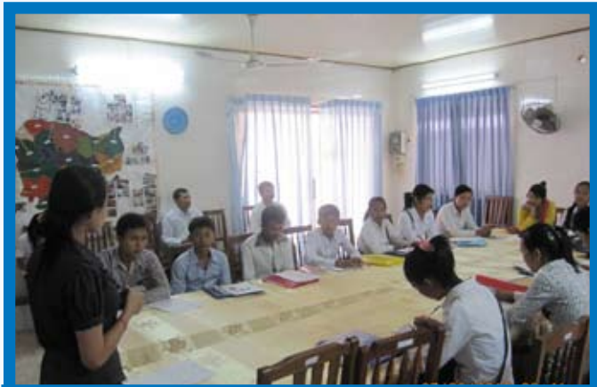
តំណាងកុមារមកពី១១រាជធានី-ខេត្តនៃបណ្តាញកុមារអ្នកតស៊ូមតិ ជួបប្រជុំប្រចាំត្រីមាស

ជាមួយនឹងបញ្ហាខាងលើនេះ ក្រុម បណ្តាញកុមារអ្នកតស៊ូមតិបានមើលឃើញថា មូលហេតុដែលបណ្តាលឱ្យមានក្រុមក្មេងទំនើងកើតឡើងច្រើនគឺមកពីការសេពគប់មិត្តមិនល្អ នាំគ្នាដើរលេងមិនចូលសាលា។ មួយវិញទៀតអាច មកពីគ្រួសារ និងអាណាព្យាបាល ដែលធ្វេសប្រហែស មិនបានតាមដានសកម្មភាព និងការសិក្សារបស់កូន រួមផ្សំនឹងភាពទំរើស យកចិត្តកូនពេក និងមិនមានឱកាសក្នុងការអប់រំទូន្មានកូន។