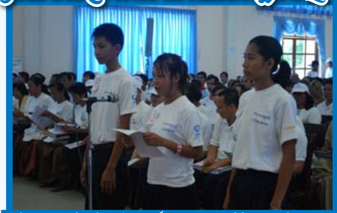
តំណាងកុមារថ្លែងចំណាប់អារម្មណ៍កុមារក្នុងឱកាសមិថុនាអបអរទិវាកុមារអន្តរជាតិ ១ មិថុនា ២០១០