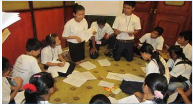
ការសេចក្តីព្រាងរដ្ឋាភិបាល, ថ្ងៃទី ១៦ ខែវិច្ឆិកា ឆ្នាំ២០១០

លោកបន្តថាការចូលរួមវេទិកានេះបញ្ជាក់អោយឃើញថាយើងទាំងអស់គ្នាខិតខំយកចិត្តទុកដាក់អនុវត្តសិទ្ធិចំបងទាំង ៤ របស់កុមារដែលក្នុងនោះមានទាំងសិទ្ធិបញ្ចេញទស្សនៈនិងការគោរពទស្សនៈរបស់កុមារផងដែរ ។