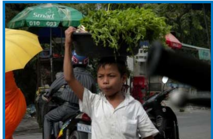
កុមារលក់បន្លែជួយសំរួលជីវភាពគ្រួសារ

ធ្វើឱ្យប៉ះពាល់ដល់សុខភាពរបស់កុមារម្នាក់ៗ និងធ្វើឱ្យយឺតយ៉ាវដល់ការកាត់បន្ថយភាពក្រីក្រ និងកិច្ចប្រឹងប្រែងអភិវឌ្ឍន៍របស់ប្រទេសជាតិផងដែរ។ ជាការពិតណាស់កុមារនៅរាជធានីភ្នំពេញមានមួយភាគបួនដើររើសអេតចាយទាំងយប់ទាំងថ្ងៃ និងមួយភាគទៀតដើរសុំទាននៅតាមដងផ្លូវ និងនៅតាមភោជនីយដ្ឋាននានាពេលរាត្រី។ រីឯមួយចំនួនទៀតទូលបន្លែលក់នៅតាមផ្លូវសាធារណៈ និងនៅតាមទីផ្សារនានាក្នុងរាជធានីភ្នំពេញមិនបានចូលរៀននោះទេ បញ្ហានេះក៏ព្រោះតែជីវភាពជាចម្បងដែរ ។