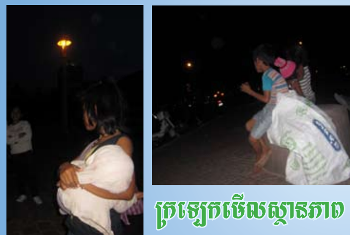
ក្រឡេកមើលស្ថានភាព

ក្នុងរយៈពេលប៉ុន្មានឆ្នាំចុងក្រោយនេះ រាជធានីភ្នំពេញមានការរីកចំរើនយ៉ាងខ្លាំង ជាពិសេសសំណង់អាគារ ហេដ្ឋារចនាសម្ព័ន្ធសួនច្បារ កន្លែងកំសាន្ត និងជីវភាពរបស់ប្រជាជន មានការកែលំអ និងអភិវឌ្ឍន៍គួរឱ្យកត់សម្គាល់។ រៀងរាល់ល្ងាច នៅតាមទីសាធារណៈសួនច្បារ និងកន្លែងកំសាន្តនានា ប្រជាជននៃទីក្រុងចំណាស់មួយនេះតែងប្រមូលផ្តុំគ្នាសម្រាកលំហែរពីកិច្ចការប្រចាំថ្ងៃរបស់ខ្លួនជាមួយក្រុមគ្រួសារ មិត្តភក្តិ ដែលបង្ហាញឱ្យឃើញពីជីវិត សុរិយល័យទាន់សម័យថ្មីមួយ។