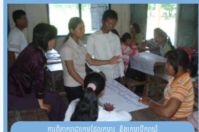
ការពិភាក្សាក្រុមដែលកុមារ និងក្រុមប្រឹក្សាឃុំ ជជែកផ្លាស់ប្តូរយោបល់គ្នា