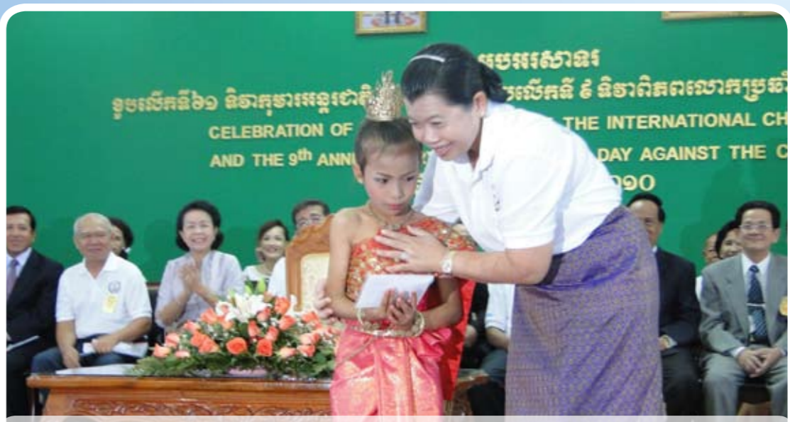
លោកជំទាវ ម៉ែន សំអន ឧបនាយករដ្ឋមន្ត្រីប្រចាំការ សំដែងសម្ភារចិត្តចំពោះកុមារីសិល្បៈការិនី ដែលរាំរាំស្វាគមន៍គណៈអធិបតីនាឱកាសមិថុនាអបអរទិវាកុមារអន្តរជាតិ ១ មិថុនា ២០១០ នៅភ្នំពេញ