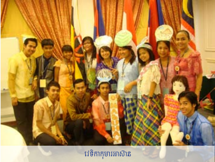
វេទិកាកុមារអាស៊ាន