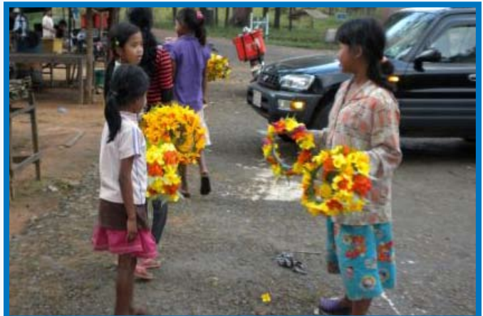
កុមារលក់បន្លែជួយសំរួលជីវភាពគ្រួសារ

ជាការពិតណាស់ ទោះបីច្បាប់បំបាត់អំពើហិង្សាលើកុមារ និងពលកម្មលើកុមារត្រូវបានរដ្ឋសភា ចេញឱ្យប្រើប្រាស់ដើម្បីទប់ស្កាត់ការប្រើប្រាស់ពលកម្មកុមារយ៉ាងណាក៏ដោយ តែបច្ចុប្បន្ននៅតាមទីប្រជុំជន ទីក្រុង ឬជនបទ ដាច់ស្រយាលតាមបណ្តាខេត្ត-ក្រុងនានា ជាពិសេសនៅក្នុងរាជធានីភ្នំពេញ និងនៅតាមតំបន់ទេសចរណ៍នានា គេតែងសង្កេតឃើញកុមារចាប់ពីអាយុ៣ទៅ៤ឆ្នាំ ពី៦ទៅ៩ឆ្នាំដើរសុំទាន ឬប្រកបរបរលក់ដូរ និងដើររើសអេតចាយជាដើម ។ ការប្រឈមនឹងការបោះបង់ពីសាលារៀននេះ ដោយសារភាពក្រីក្ររបស់គ្រួសារកុមារនីមួយៗ។